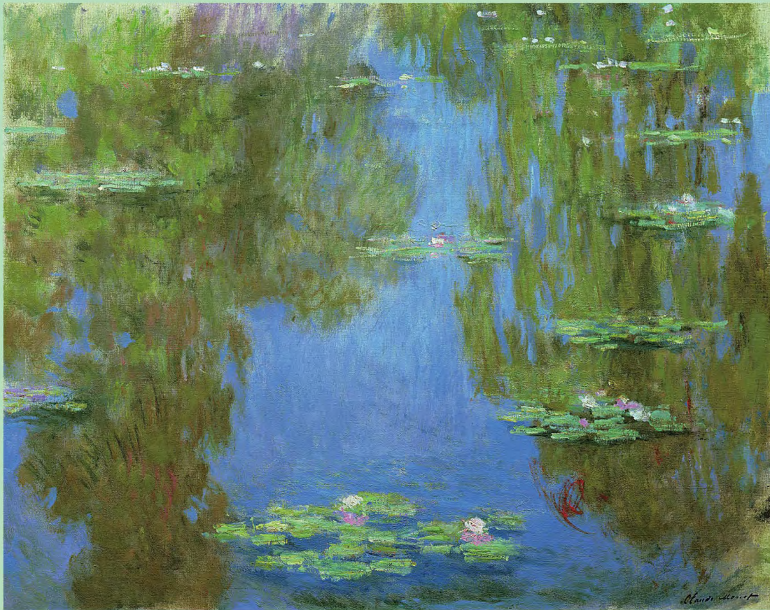
クロード・モネ《睡蓮》 1903年 Musée Marmottan Monet, Paris